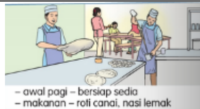
- awal pagi - bersiap sedia - makanan - roti canai, nasi lemak