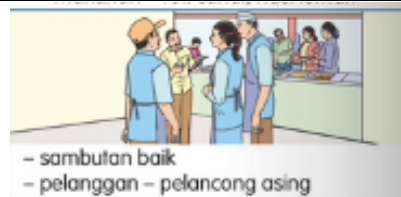
- sambutan baik - pelanggan - pelancong asing