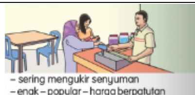
- sering mengukir senyuman - enak - popular - harga berpatutan