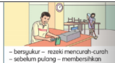
- bersyukur - rezeki mencurah-curah - sebelum pulang - membersihkan