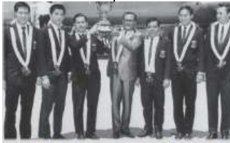
Pasukan badminton Malaysia menjuarai Piala Thomas pada tahun 1967 selepas mengalahkan Indonesia 6-3.