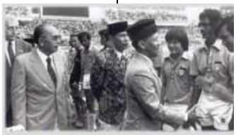
Pasukan hoki kebangsaan dalam pertandingan Hoki Piala Dunia 1975, diperkenalkan kepada Seri Paduka Baginda Yang di-Pertuan Agong V, Sultan Abdul Halim Mu'adzam Shah ibni Almarhum Sultan Badlishah.