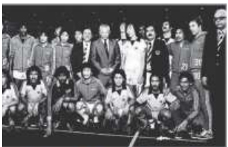
Pasukan bola sepak kebangsaan berjaya melayakkan diri ke Sukan Olimpik Moscow pada tahun 1980 selepas mengalahkan Korea Selatan 2-1.