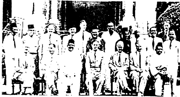
Kabinet pertama pada tahun 1955