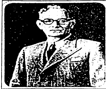
Dato' Onn Jaafar

Mengapakah beliau menubuhkan parti tersebut?