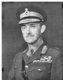
Sir Gerald Templer

30 Mengapakah tokoh di atas meminta idea gagasan Malaysia disegerakan?