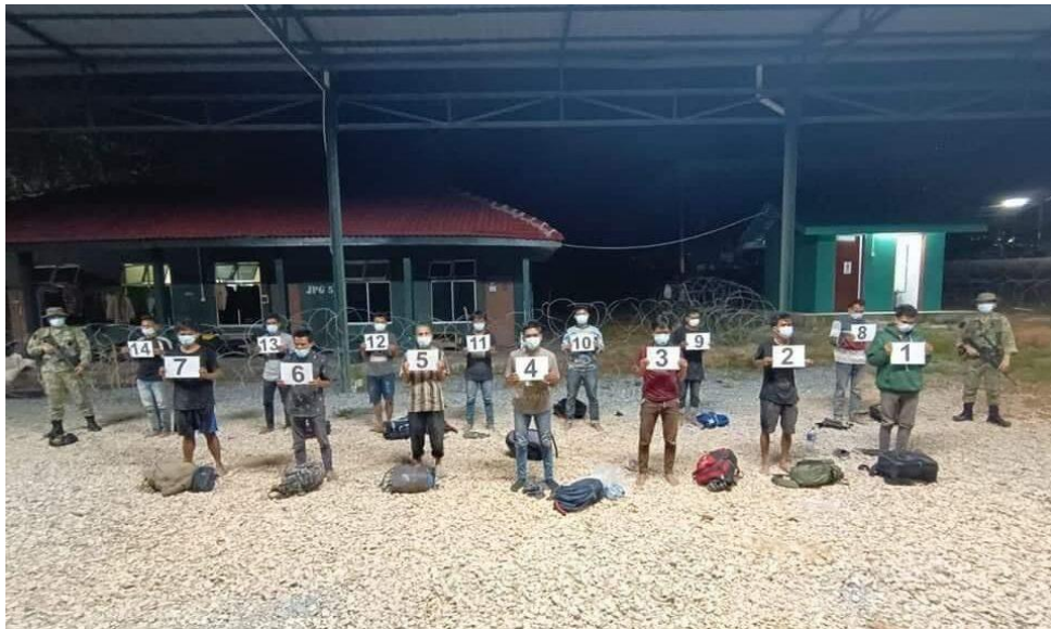
17 PATI Indonesia gagal menyusup masuk guna 'jalan tikus'

(c) Gambar 6 berkaitan dengan kemasukan Pendatang Asing Tanpa Izin (PATI) ke Malaysia