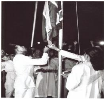
Bendera Union Jack diturunkan

Apakah yang dapat dibuktikan daripada peristiwa tersebut?