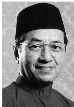
Perdana Menteri Ketiga dan Ketujuh Tun Dr Mahathir bin Mohamad

Apakah takrifan kemerdekaan mengikut negarawan di atas?