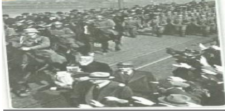
Gambar menunjukkan pendudukan Jerman di Rhineland pada tahun 1939