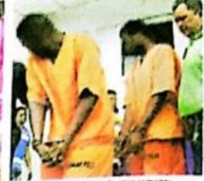
Wanita Malaysia ditahan bersama syabu 1.7kg...